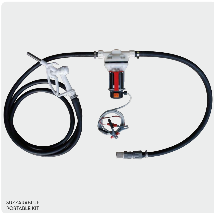
SUZZARABLU PORTABLE KIT