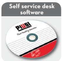
Self service desk software