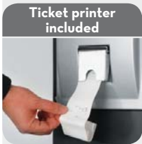
Ticket printer included