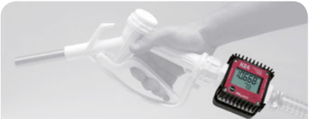
K24 for reconstituted milk for cattle + manual nozzle Code F00870030