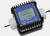
K24 ENO approved for wine and beer (on request)