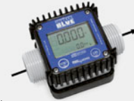
K24 for Urea