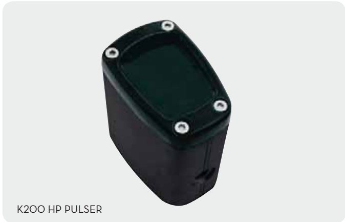
K200 HP PULSER