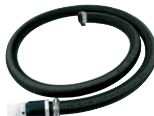
Kit suction hose with foot valve (optional)