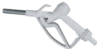
Manual nozzle available Code: F14716000