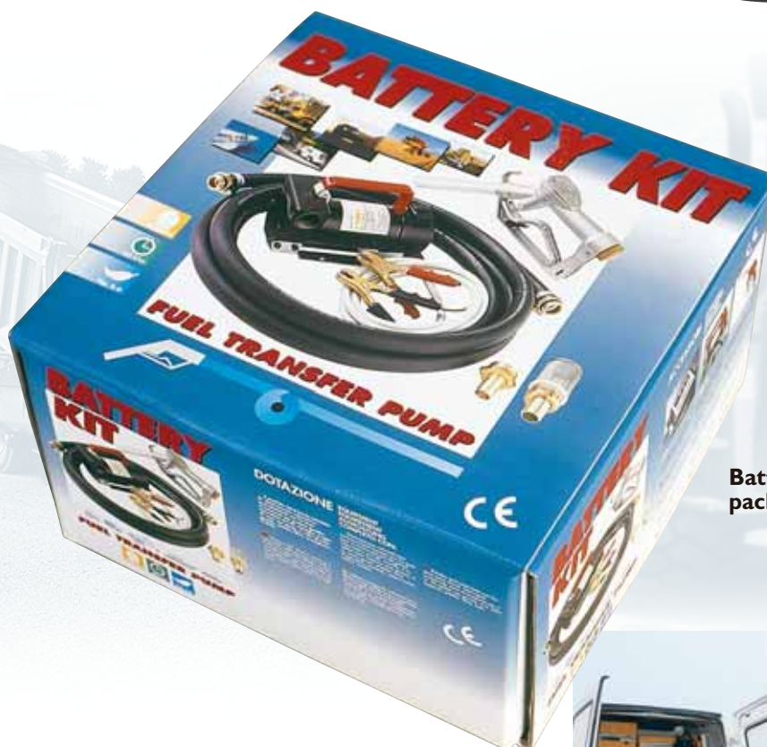
Battery kit packaging